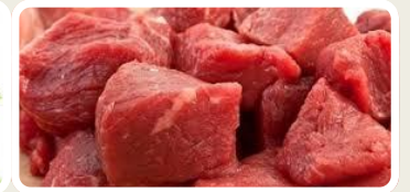
Prediksi Ketersediaan dan Konsumsi Daging Sapi